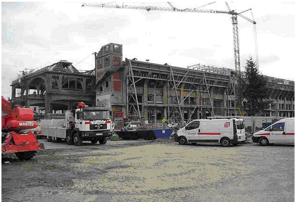
Fig.6 - Vue du bâtiment et du chantier (2005)