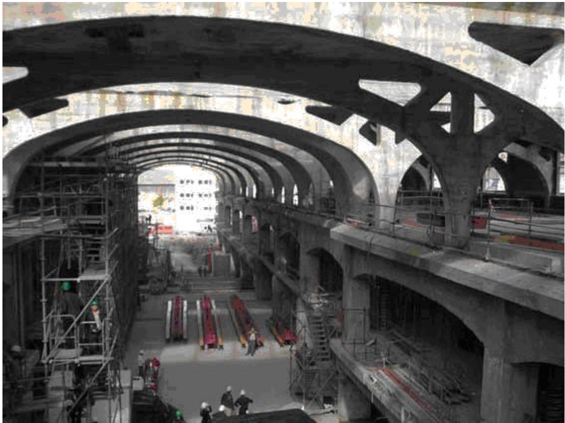
Fig.7 - Chantier de reconversion d'une travée (2005)