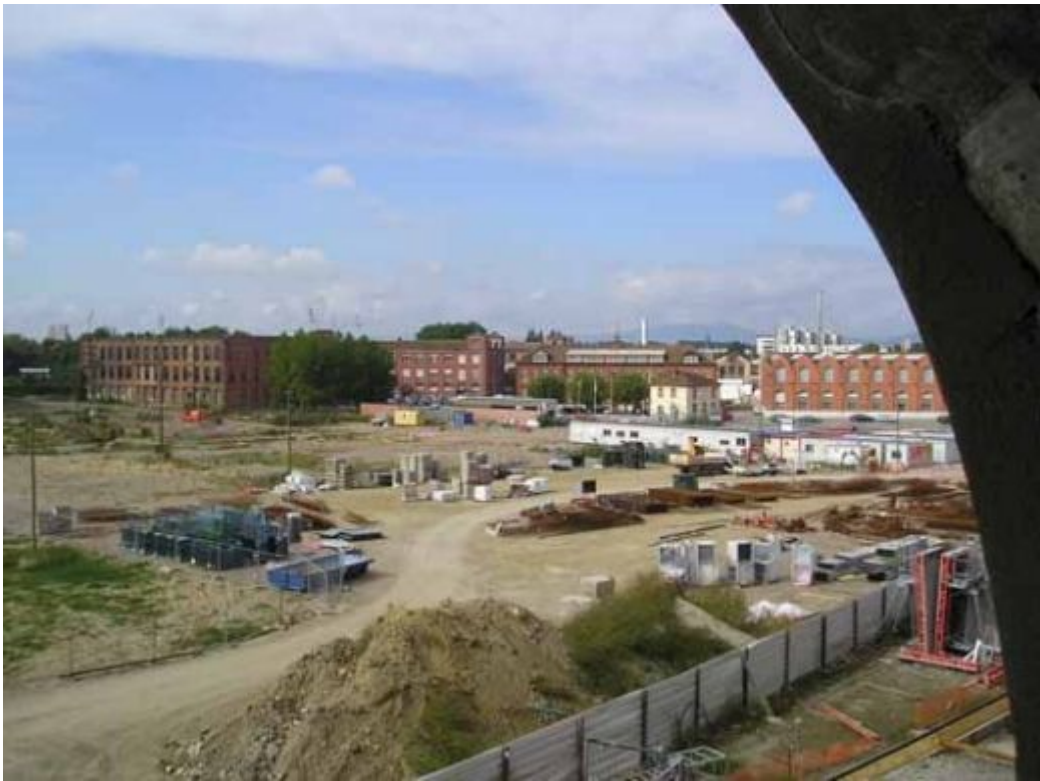
Fig.9 – Vue depuis le 2eme étage de la Fonderie vers les bâtiments restant sur le site