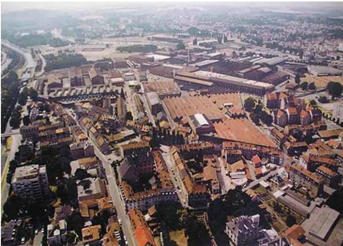
Fig.4 - Vue du site industriel de la SACM et du quartier de la fonderie (environ 1985)