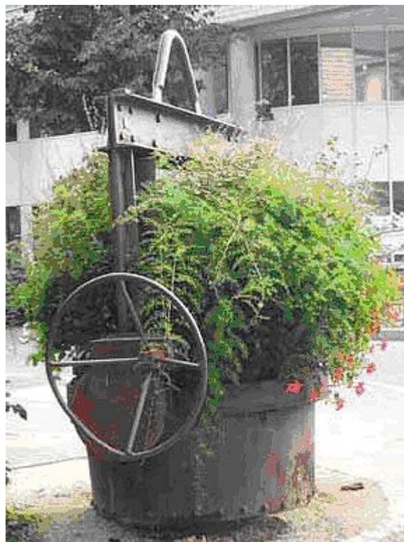
Fig.8 - Une ancienne poche de coulée