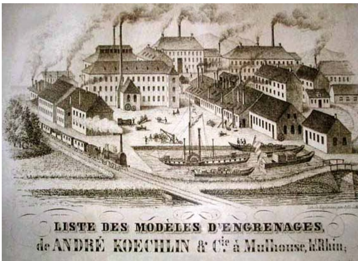
Fig.2 - La Société « AKC » avec le canal, le port et la ligne de chemin de fer (environ 1845)