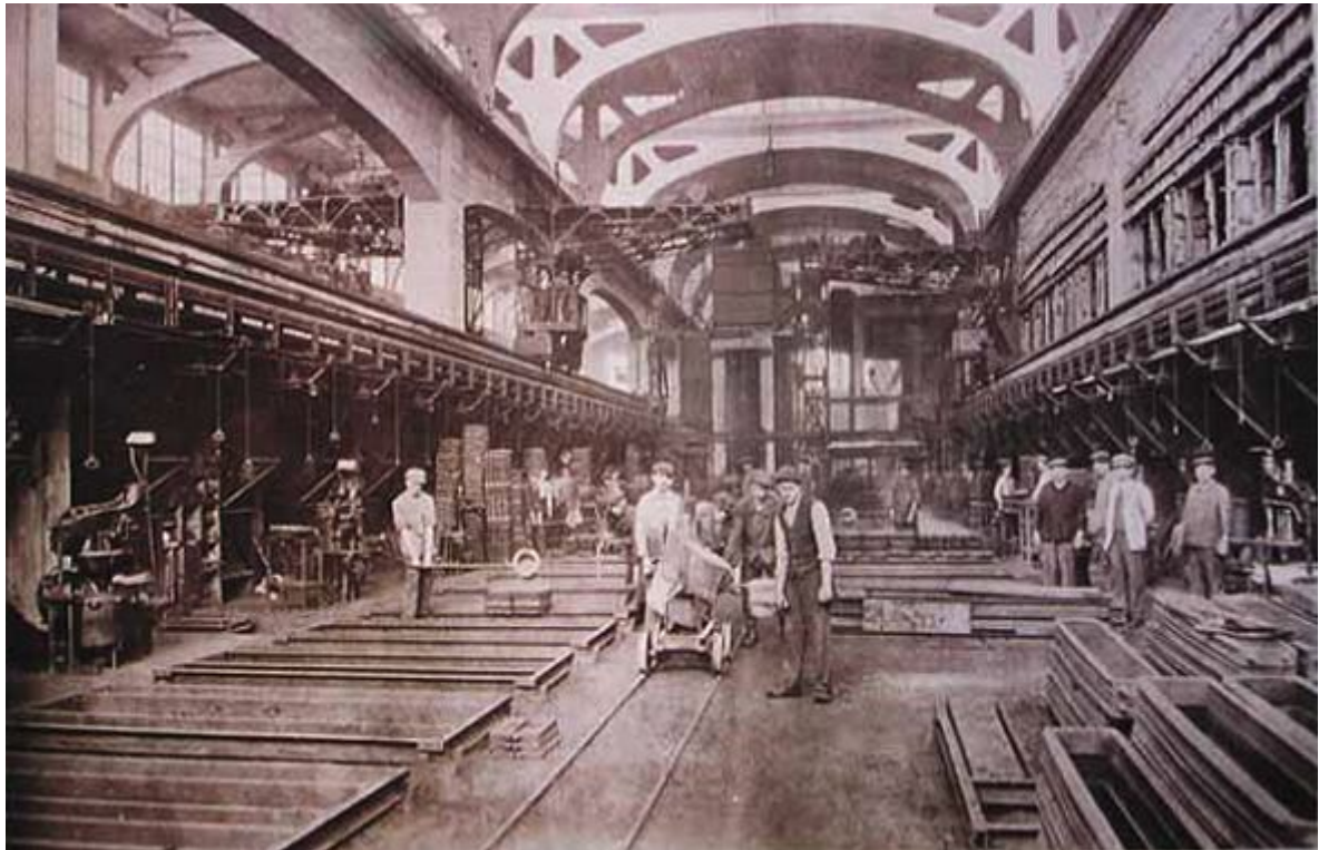
Fig.5 - Intérieur de la Fonderie : installations de moulage et de coulé